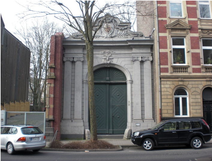
Karlstor und Kutscherhaus