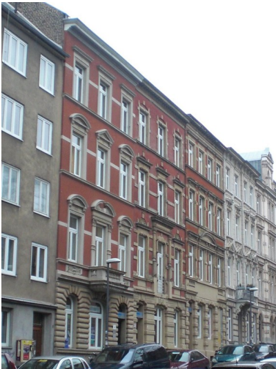
RWTH Wohnhäuser Kármánstraße 7, 9, 11 in Aachen