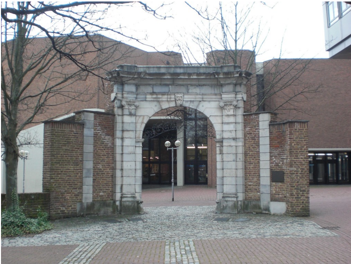
Das sogenannte Barocktor, ein Torbogen vom Klosterrather Hof, in der Eilfschornsteinstraße 15 in Aachen