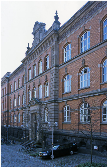
RWTH Philosophische Fakultät