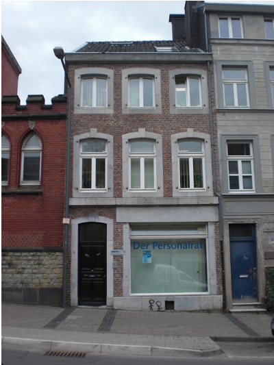
RWTH Wohnhaus, Eilfschornsteinstraße 14 in Aachen