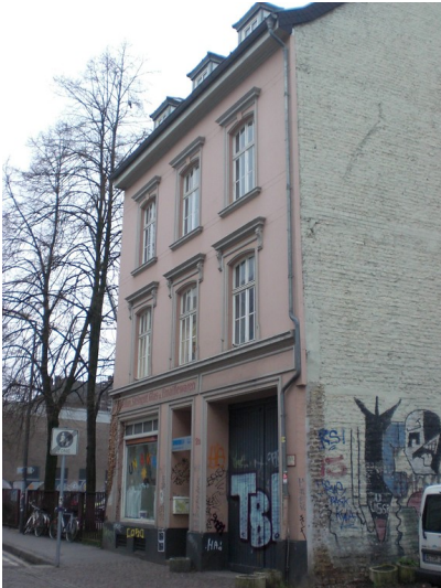
RWTH Institut für biblische und historische Theologie