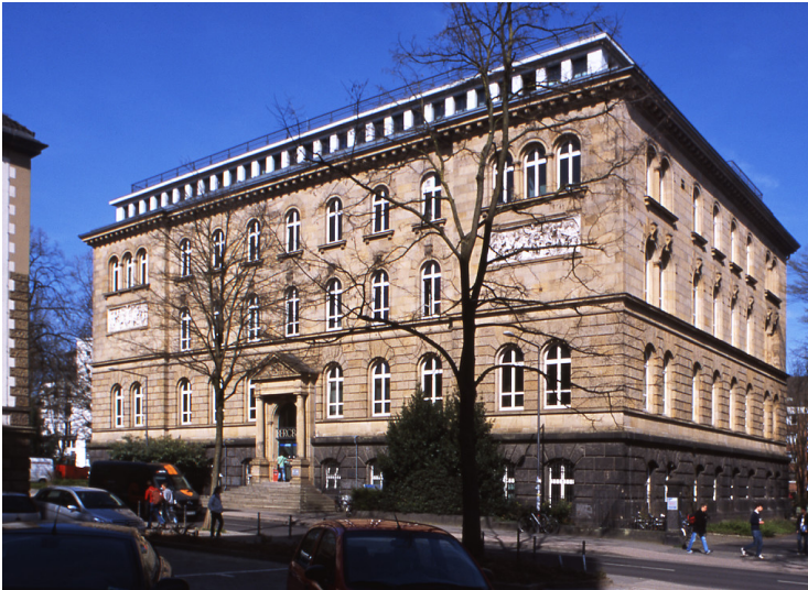
Gebäude des Instituts für Bergbau und Elektrochemie / Bergbau und Hüttenwesen der RWTH Aachen, Wüllnerstraße 2