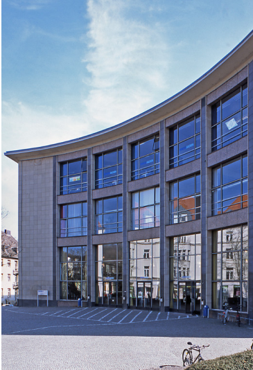
Das große Hörsaalgebäude der RWTH Aachen in der Wüllnerstraße 9