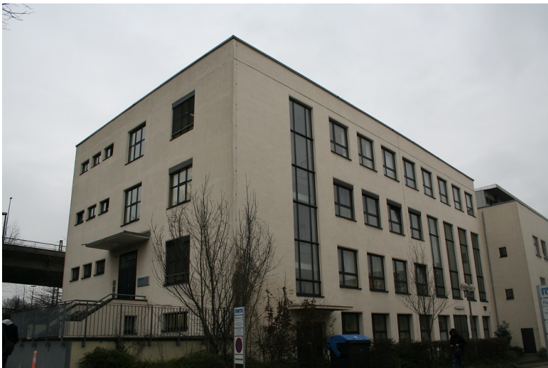
RWTH Institut für elektrische Maschinen