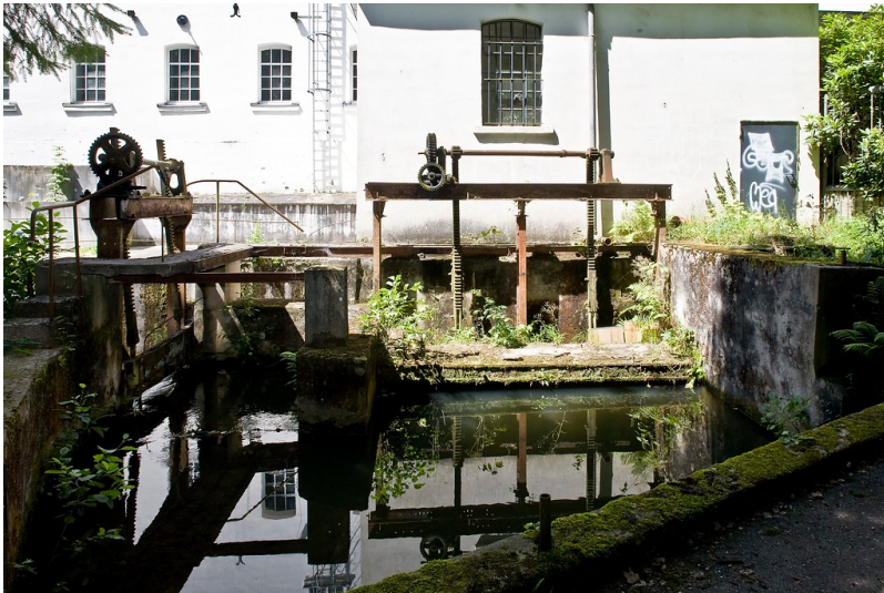
Stark & Biedermann