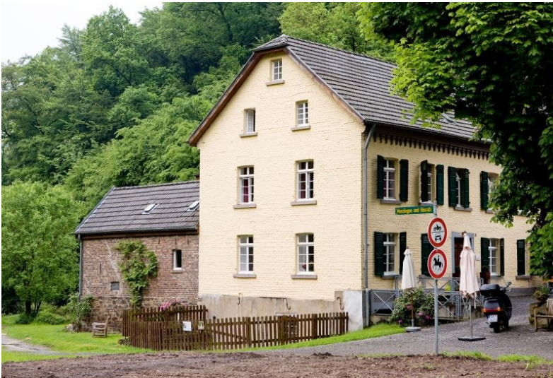
Kupfersiefer Mühle