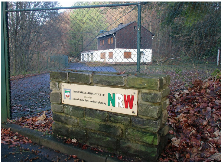
Zugang zum heutigen Dokumentationszentrum "Ausweichsitz NRW", dem früheren Atombunker der Landesregierung in Kall (2016).