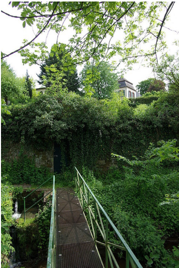
Bereich des 'Tempels am Herrenbrünnchen' im heutigen Stadtteil Trier-Heiligkreuz (2011)