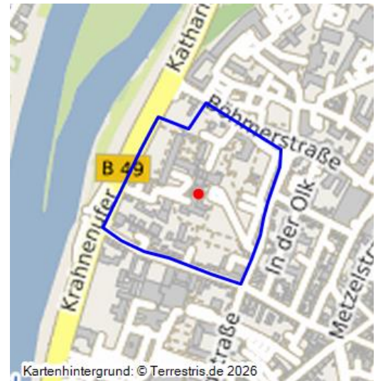
Kartenhintergrund: © Terrestris.de 2026

Name / Patrozinium: Oeren, auch Irminen / Maria ad Horrea, zusätzlich Irmina.