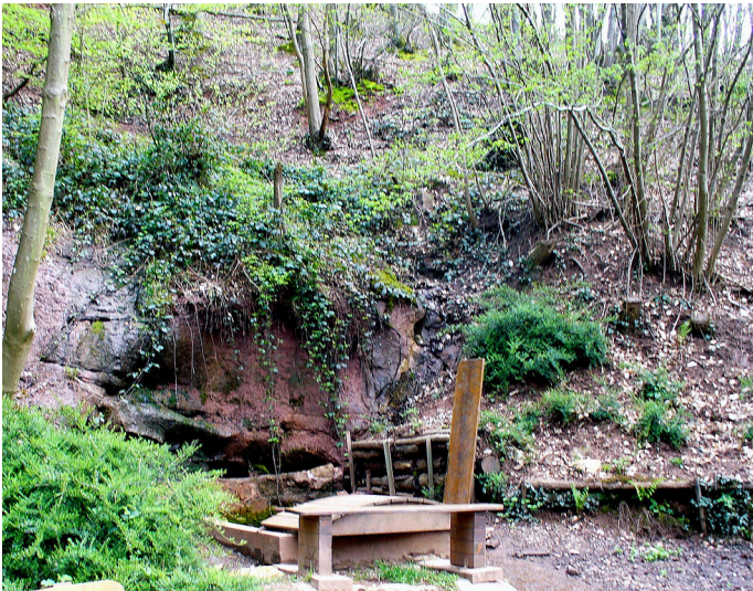
Der 'Heidenborn' am so genannten 'Irminenwingert', die Quelle beim römischen Lenus-Mars-Tempel zu Trier (2008)