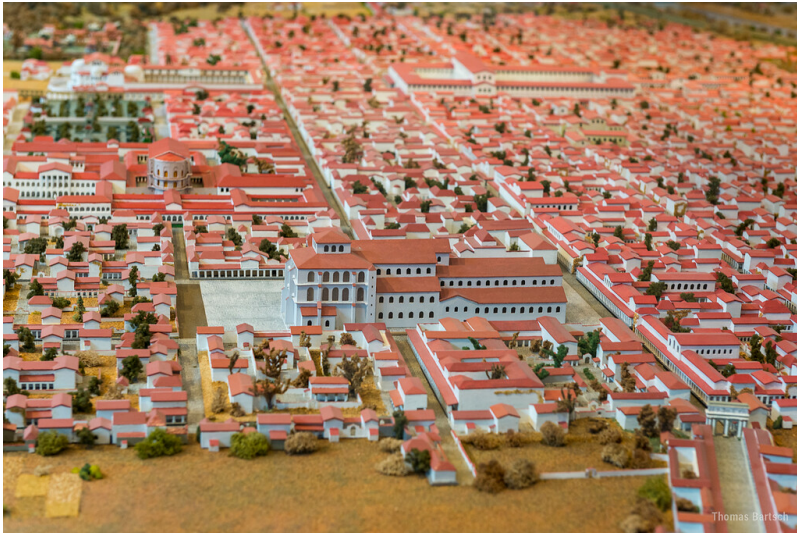
Darstellung der konstantinischen Doppelkirchenanlage mit zwei nach Osten ausgerichteten, dreischiffigen Basiliken (der spätere Trierer Dom) auf dem Stadtmodell der römischen Augusta Treverorum im 4. Jahrhundert im Rheinischen Landesmuseum Trier (2022).