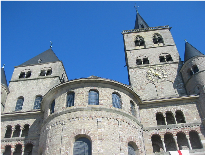
Oberer Teil der Westfassade des Trierer Domes, der aus der vormaligen Konstantinischen Doppelkathedrale hervorgegangen ist (2010)