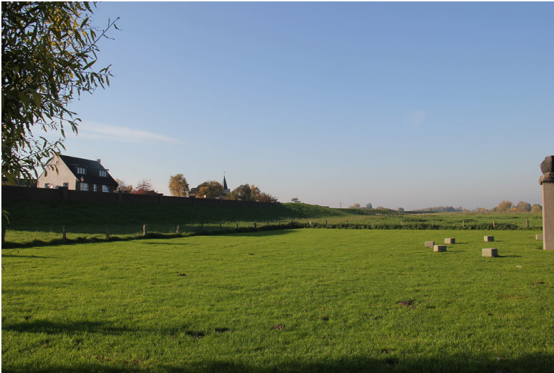
Der Rheindeich und das Deichvorland bei Grieth im Kreis Kleve (2015).