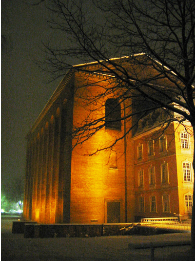
Die Römische Palastaula in Trier, die so genannte Konstantinbasilika, aus südlicher Richtung vom Palastgarten aus gesehen (2004). Rechts im Bild schließt sich ein Gebäudeteil des kurfürstlichen Palais an.