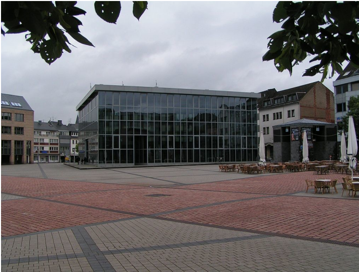
Blick über den Trierer Viehmarktplatz mit dem Schutzbau über dem römischen Großbau mit Bäderanlage, den so genannten 'Thermen am Viehmarkt' (2007)