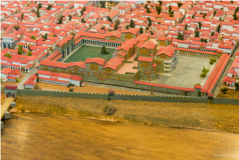
Darstellung der Barbarathermen auf dem Stadtmodell der römischen Augusta Treverorum im 4. Jahrhundert im Rheinischen Landesmuseum Trier (2022).