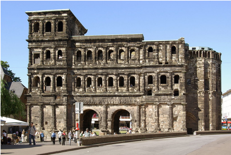
Die stadtinnere Seite des Trierer Römertors "Porta Nigra" (2008). Rechts im Bild der Choranbau der späteren Doppelkirchenanlage.