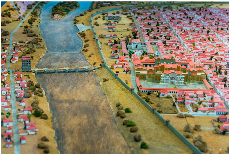
Darstellung des Stadttors "Porta Inclyta" an der Römerbrücke und die Barbarathermen auf dem Stadtmodell der römischen Augusta Treverorum im 4. Jahrhundert im Rheinischen Landesmuseum Trier (2022).