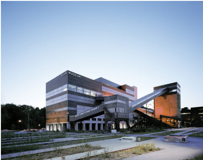
Außenansicht der früheren Kohlenwäsche von Zeche Zollverein, das heutige Ruhr Museum.