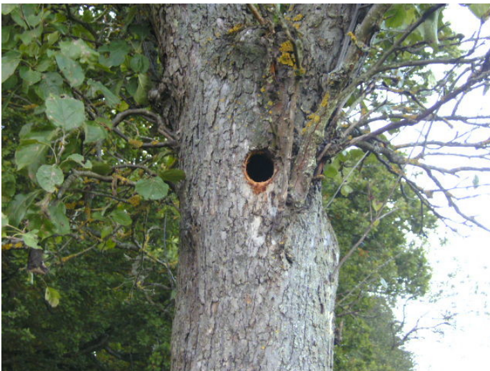
Eine Spechthöhle im Stamm eines Apfelbaumes bei Bad Münstereifel, Gut Vogelsang (2013).