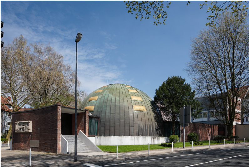
Neue Synagoge Essen (2013)