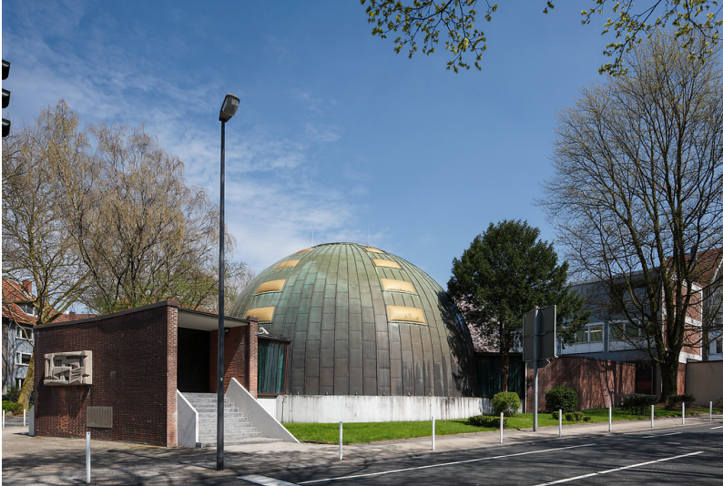
Neue Synagoge Essen (2013)