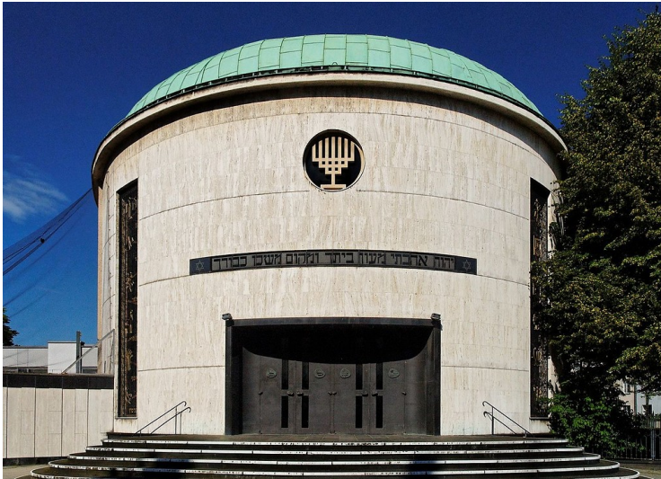
Das Gebäude der Neuen Synagoge am jüdischen Gemeindezentrum in der Ziethenstraße in Düsseldorf-Derendorf (2009)