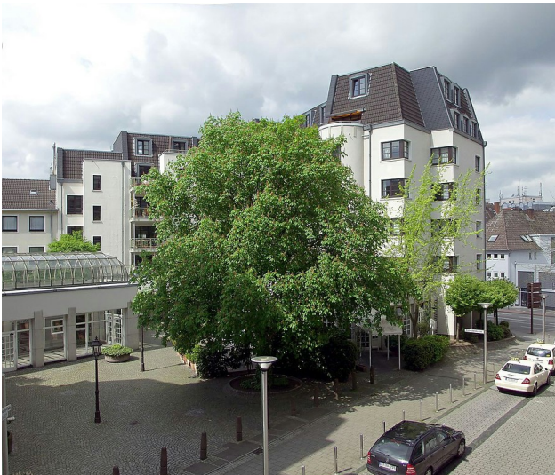
Blick aus südöstlicher Richtung auf den Erich-Klibansky-Platz in Köln-Altstadt-Nord (2008), früherer Standort des jüdischen Reform-Realgymnasium Jawne.