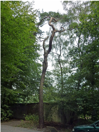
Rauchschäden an Bäumen im Duisburger Stadtwald (2012).