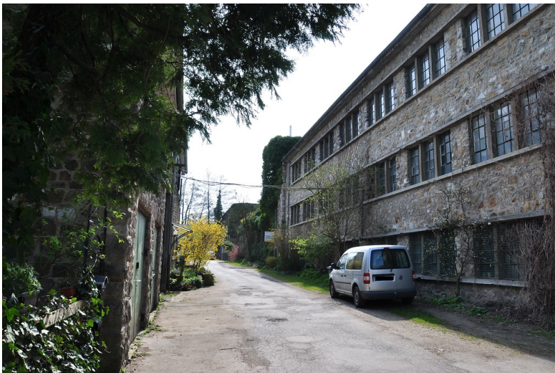
Haumühle - Fabrikgebäude (2014)