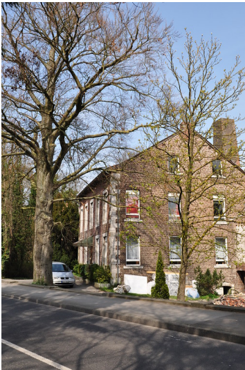
Herrenhaus Untere Buschmühle (2014)