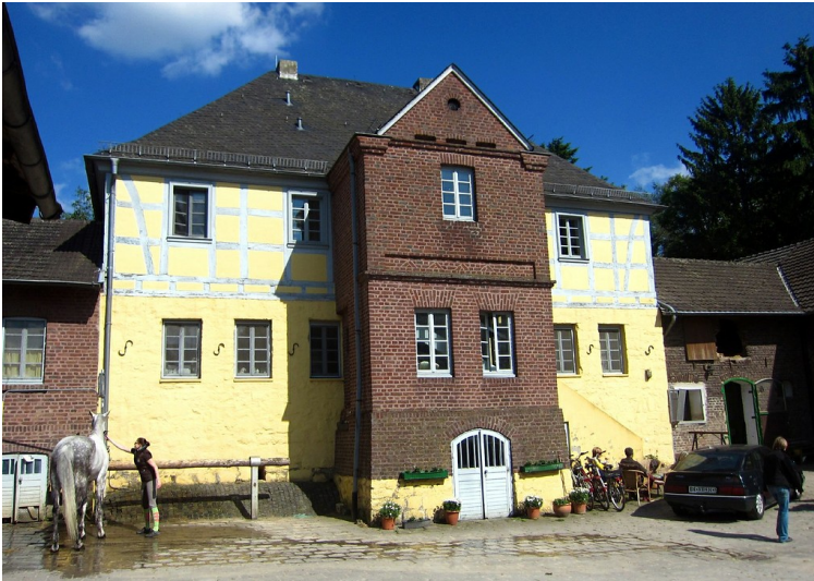
Das frühere Herrenhaus Rott als Teil des heutigen Hofes in Troisdorf-Rotter See, Ansicht vom Innenhof der heutigen Hofanlage aus (2014)