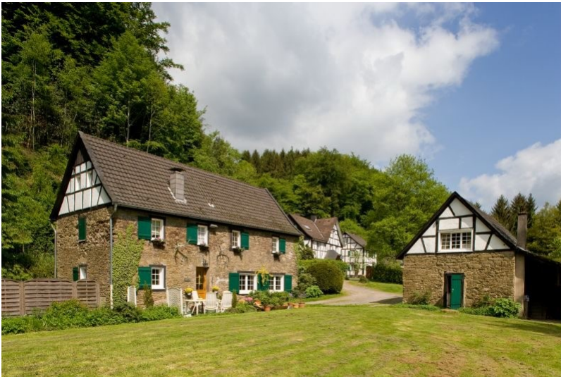
Steiner Mühle