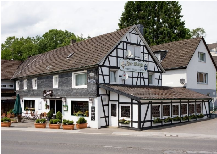
Ahlenbacher Mühle