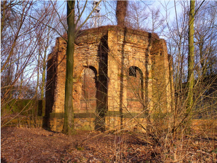
Ruine des Wasserturms auf dem Kaiserberg in Duisburg (2009).