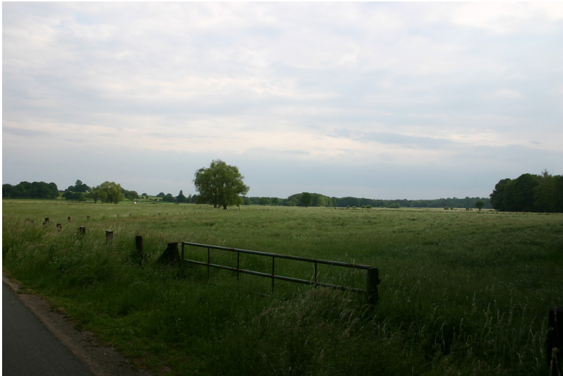
Die weitläufige Landschaft des Naturschutzgebiets Torfvenn bei Schermbeck mit Wiesen und einzelnen Bäumen (2008). Im Vordergrund steht ein Tor, das zur Straße führt.