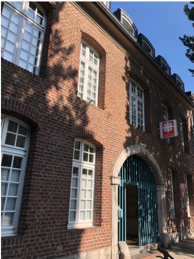
Backsteingebäude in Heinsberg (2023)