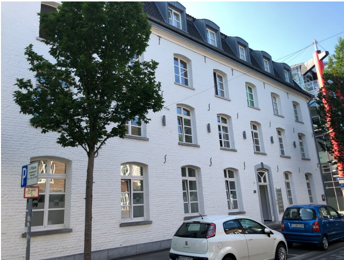
Fabrikgebäude der ehemaligen Lederwerke Windelen (2023)