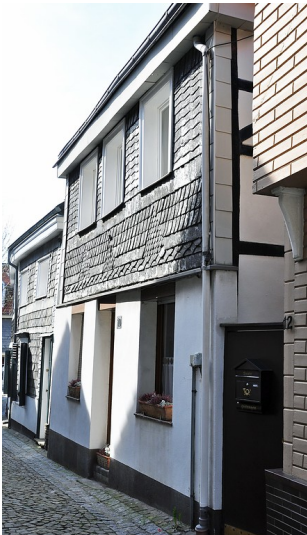
Wohnhaus Kaiserstraße 10 in Essen Kettwig