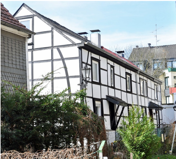
Wohnhäuser Kaiserstraße 16 und 18 in Essen Kettwig