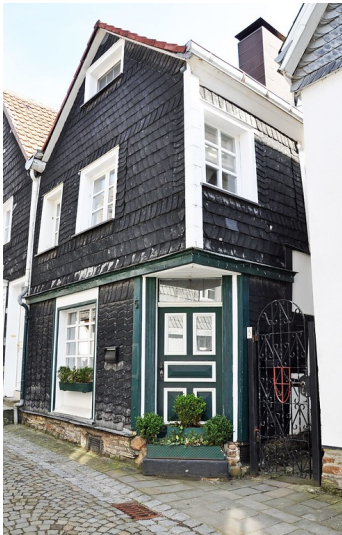
Fachwerkwohnhaus Kaiserstraße 5 in Kettwig