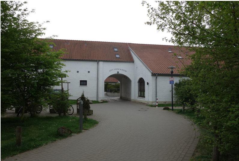
Eingang des Stöckheimerhofs (2014)