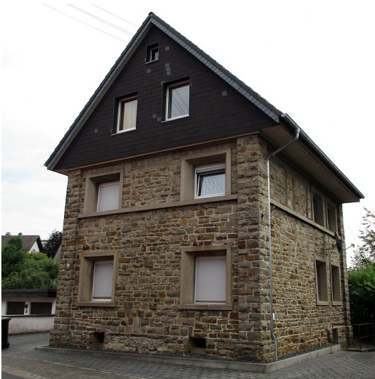
Das heute als Wohnhaus genutzte frühere Synagogengebäude in Ruppichteroth (2021).