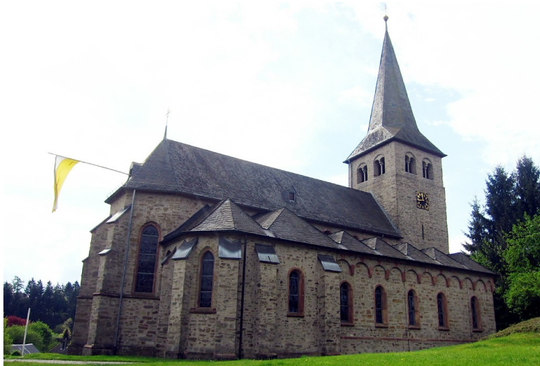
Die katholische Pfarrkirche St. Peter in Windeck-Herchen, Ansicht von Norden (2014)