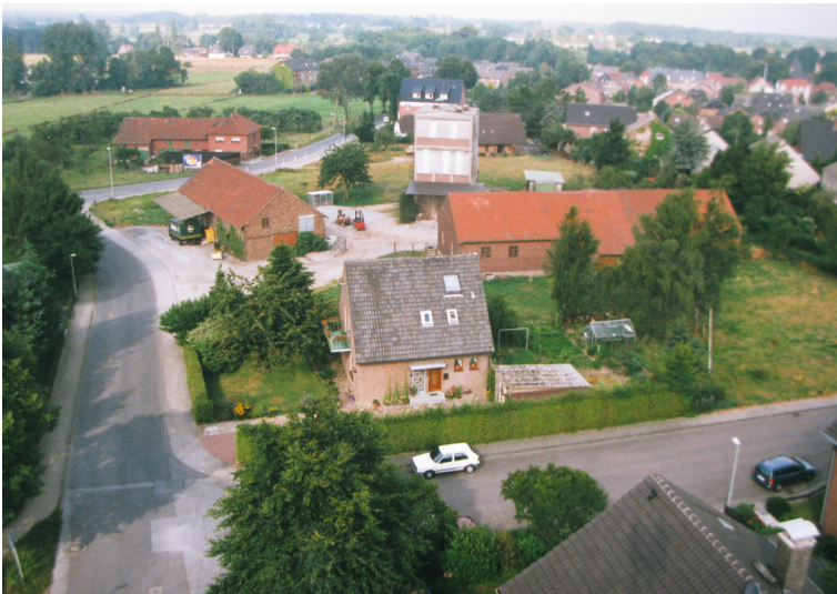
Aufnahme von einem Kran herunter auf die Gahlener Genossenschaft (1999). Man sieht einzelne Werksgebäude und Maschinen, aber auch die umliegenden Wohnhäuser.