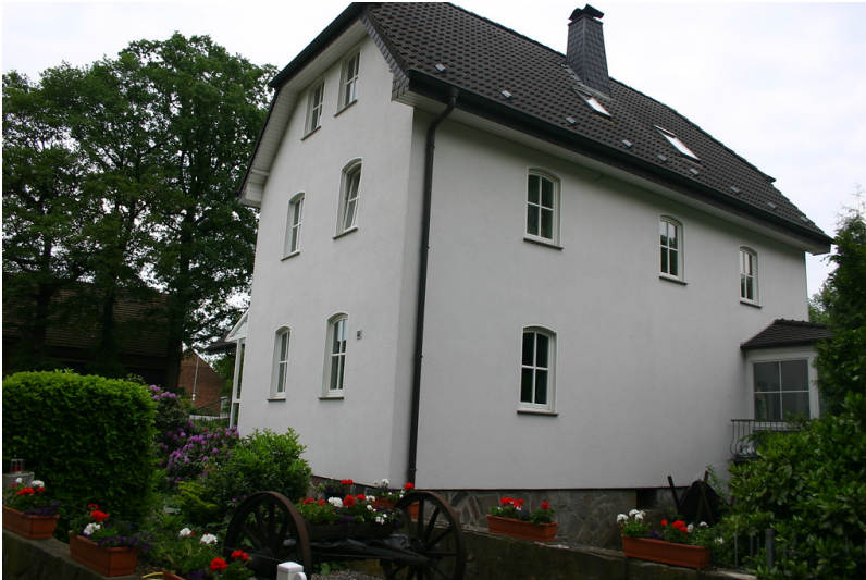
Das renovierte Gebäude der ehemaligen Gahlener Bruchmühle (2008). Das Gebäude wird mittlerweile als Wohnung genutzt.