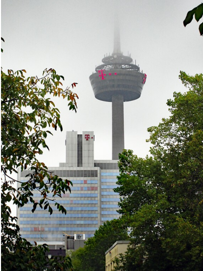
Der Fernmeldeturm "Colonius" in Köln-Neustadt-Nord, davor Gebäude der Deutschen Telekom (2020), Ansicht vom Inneren Grüngürtel im Bereich der Venloer Straße aus.