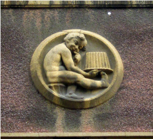
Darstellung eines Bäckerjungen mit einem Kuchen, zierendes Architekturelement an der Fassade des Wohn- und Geschäftshauses der früheren Konsumgenossenschaft „Vorwärts“ in der Sedanstraße in Barmen (2014).