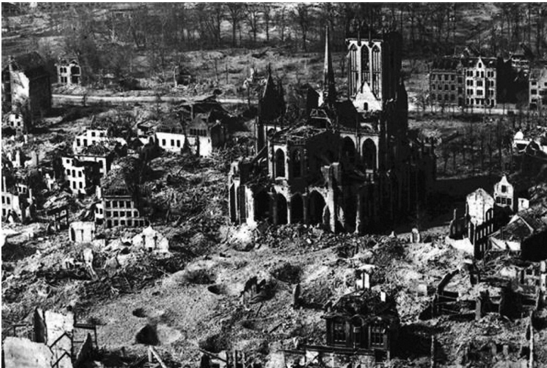
Historische Aufnahme der Zerstörungen in der Stadt Wesel zu Kriegsende 1945, zentral im Bild der Willibrordi-Dom, rechts davon die bereits 1938 weitgehend zerstörte Synagoge.